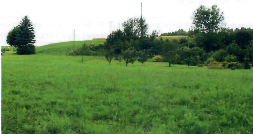
La clairière où se trouvait la mystérieuse abbaye de Haut-Crêt.

Invitation aux membres de ProLavaux- AVL et à leurs ami-e-s à la traditionnelle balade historique